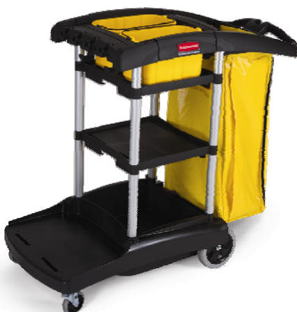
Carrello ad alta capacità