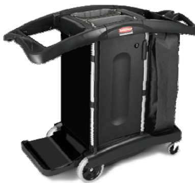
Carrello pieghevole HK