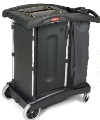
Carrello ribaltabile HK

Il carrello ribaltabile Rubbermaid è invece una soluzione ultracomatta per spazi di lavoro ristretti. Esso occupa uno spazio del 26% inferiore rispetto al carrello pieghevole. Il carrello High Security offre un doppio cofano d'accesso con chiusura di sicurezza e doppie porte chiudibili che consentono di tenere al sicuro i prodotti di pulizia.