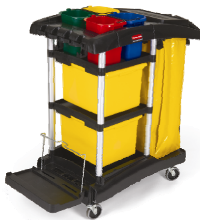
Carrello per microfibre