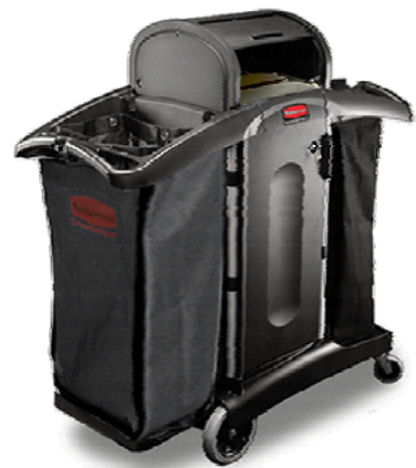
carrello High Security HK